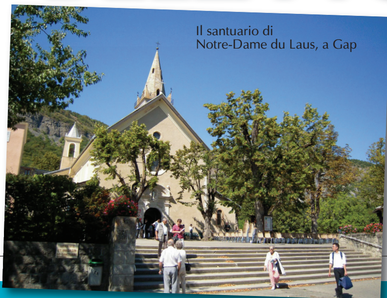
Il santuario di Notre-Dame du Laus, a Gap